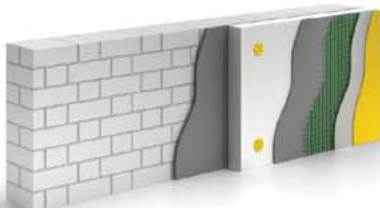
Стена из силикатного кирпича 250 мм с утеплителем ППС и штукатурная отделка