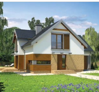
▲ Проект Муратор М160 «Оптимистичный» Дом отдельный, с мансардным этажом, камином и гаражом на один автомобиль. Общая площадь - 204,0 м 2 .

Полная Коллекция проектов Муратора на сайте www.proekty.murator.com.ua