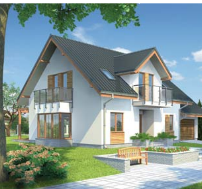
▲ Проект Муратор М466 «Шумящие тополя – вар. II» Дом отдельный для застройки в серии домов-близнецов, с мансардным этажом, камином и гаражом. Общая площадь – 230,6 м 2

Современные предприятия, такие как ООО «Аэрок», ООО «ЮДК», ООО «Ориентир-Будэлемент» выпускает широкий ассортимент стеновых и перегородочных блоков, отклонения по геометрии которых не превышает 1–2 мм. Это позволяет вести кладку не на кладочном растворе с толщиной шва 10–15 мм, а на клею с толщиной шва 2–3 мм. Таким образом, исключаются мостики холода в готовой стене, что выгодно отличает газобетонные изделия от конкурентов. Норма расхода клея в среднем составляет 25 кг/м 3 вместо кладки 120–150 кг раствора на аналогичный объем. Блоки имеют систему паз-ребень и карман для захвата, что облегчает процесс переноса и кладки камня. Один блок по объему может заменить до 18 штук рядового кирпича. Это тоже немало важно, так как это напрямую влияет на расценки по кладке.