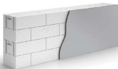
Однослойная стена из газобетонных блоков 375 мм и штукатурка