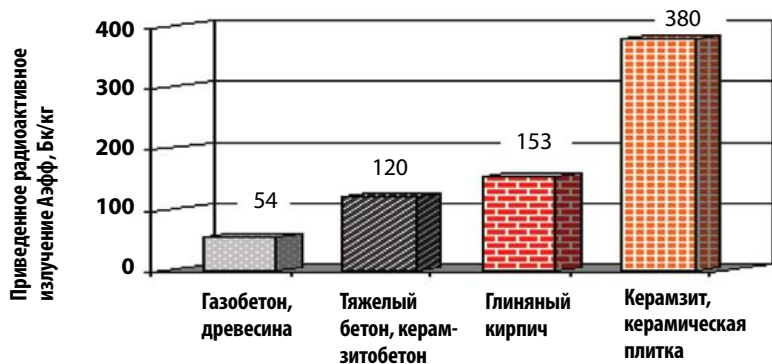
▲ Рис. 2. Содержание радионуклидов в различных строительных материалах